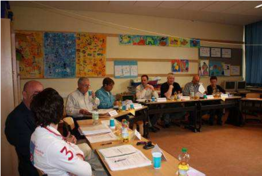
... bei der Arbeit