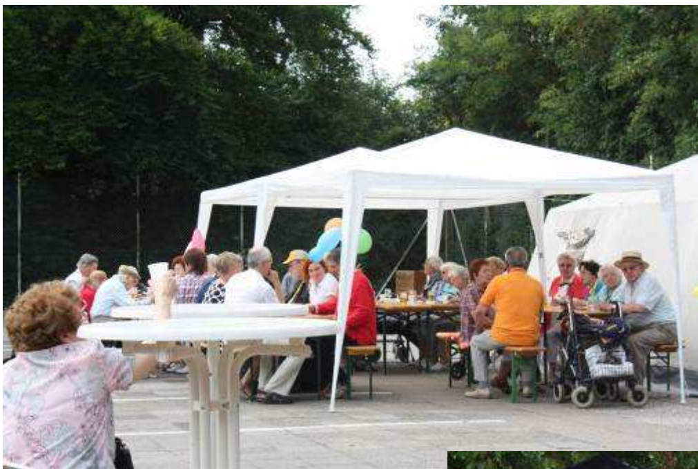
Nachbarschaftsfeste in der Sonne